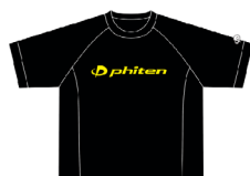
ブラック×イエロー