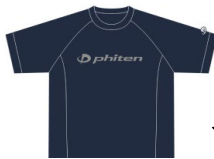
ネイビー×シルバー